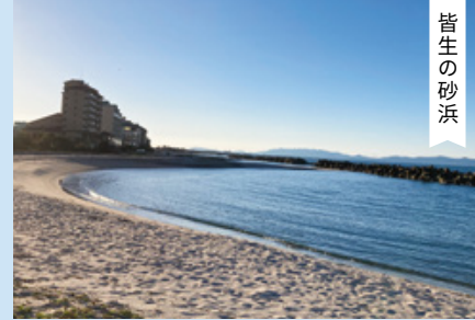
日本トリアスロン発祥の地