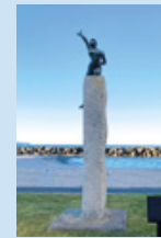
日本トリアスロン発祥記念碑