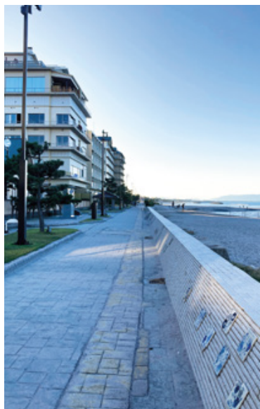
皆生・海岸遊歩道