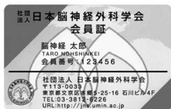
(一社)日本脳神経外科学会会員証

学会参加期間中は、合計2回、来場（学会場にきた時）および退場時（学会場から帰る時）に領域講習受付を「下記」会員証（ICカード）で行ってください。